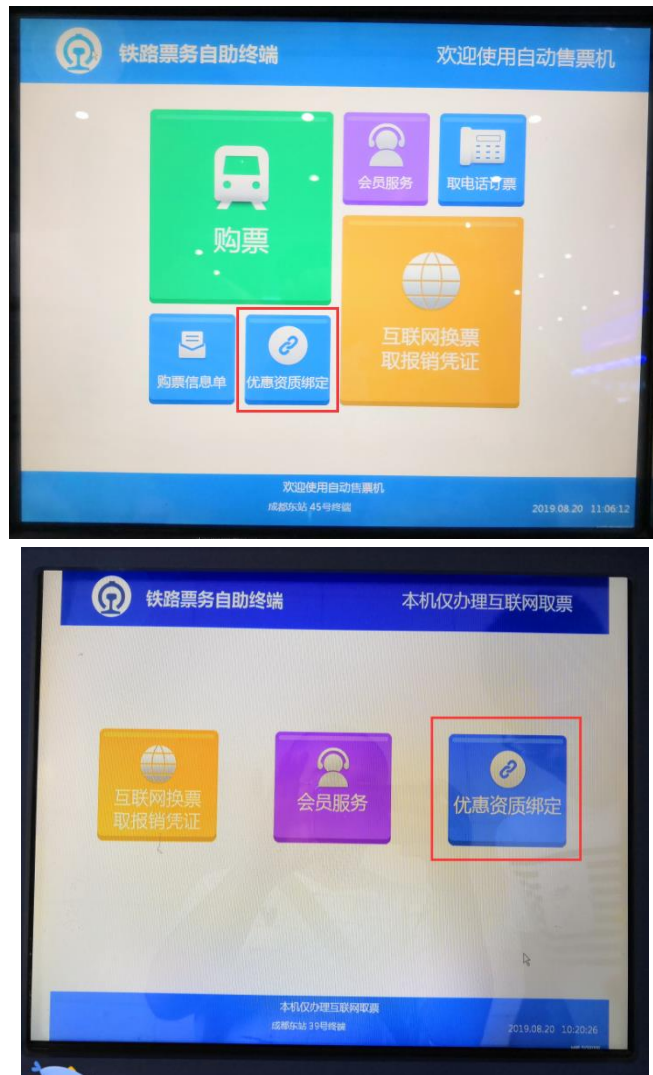
图 1：通过自动售票机绑定资质（持身份证、火车票优惠卡）